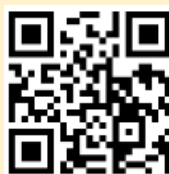
議程 (主辦單位有權視疫情狀態調整、取消及相關活動內容)